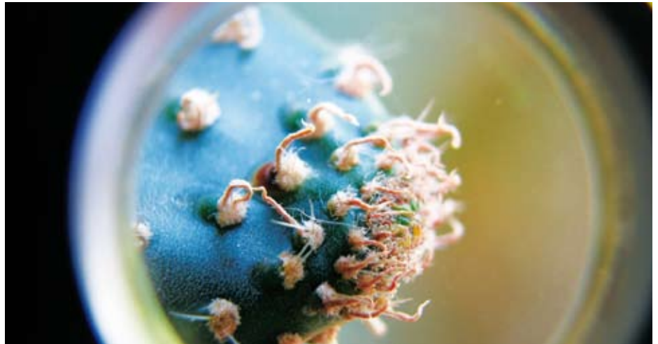
Natur als Lebensspender: Die Schweiz ist wichtiges Zielland für Wirtschaftsspionage in der Pharma- und Chemiebranche.

Die Beschaffung von Informationen aus der Wirtschaft läuft in den meisten