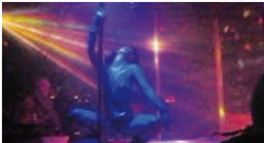
Nightclub: Wie vor Jahrzehnten arbeiten Informationsbeschaffer immer noch mit dem «Lächeln des Ostens», um Informationsträger willig zu machen.

len Substanz das Bruttosozialprodukt von vielen Ländern dieser Erde bei weitem übertreffen. Neben den politischen Staaten haben sich eigentliche 'wirtschaftliche Staaten' (transnationale Konzerne) etabliert, die zur Abwehr der Wirtschaftsspionage nachrichtendienstliche Strukturen aufbauen oder aufgebaut haben, wie dies bis anhin lediglich von Staaten bekannt war.